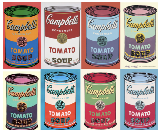
Andy Warhol, Campbell's Soup Cans (1962)

Peut-on encore parler d'art quand les artistes abandonnent les techniques classiques ?